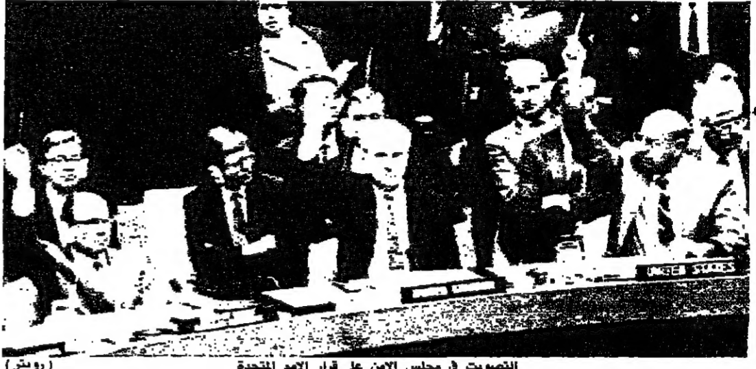
التصويت في مجلس الأمن على قرار الأمم المتحدة

بدأ الأمين العام للأمم المتحدة بيريز دي كويار يوم الخميس ١٤ أيار ١٩٩٠ في الكويت في اجتماع مع وزير الخارجية العراقي طارق عزيز للقاءه الاسبوع المقبل في نيويورك او جنيف للبحث عن حل سلمي للازمة. وصرح دي كويار خلال مؤتمر صحفي عقده في بوفوتا حيث يقوم بزيارة رسمية منذ الاربعة الايام دعوت وزير الخارجية العراقي طارق عزيز الى لقاى سريعا في نيويورك او جنيف للبدء بمشاورات كاتل لوجهات النظر حول الازمة الحالية والتي افضل ان يكون ذلك الاسبوع المقبل. واوضح الأمين العام للأمم المتحدة انه بعد صدور خمسة قرارات للأمم المتحدة حول الازمة، حان الوقت ليقوم الأمين العام بجهود دبلوماسية لتخفيف الازمة في الخليج في جميع اوجهها عبر عملية حوار. وأضاف دي كويار ان مجلس الأمن قام خلال الاسبوعين الماضيين بعمل بالغ الأهمية. وقال ان دعوة طارق عزيز تمثل مسعى دبلوماسيا ثمرته من تلقا نفسي، موضحا انه سيجعل بشكل مطبق لجميع مبادرات مجلس الأمن. وأضاف دي كويار ان مجلس الأمن لا (البقية على الصفحة ٩)